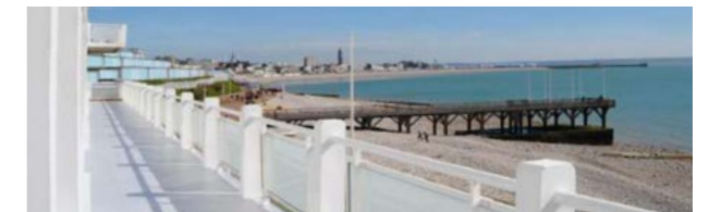
Palais des Régates, Sainte Adresse